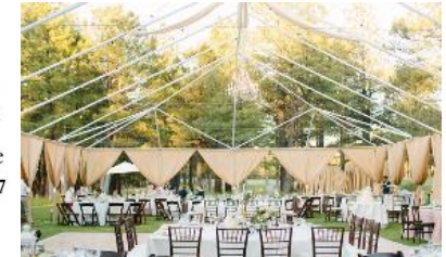
싱가포르 국제상사법원 소속 법조인 및 국제중재 전문가들과의 미팅을 통한 중재 업무 인적 네트워킹 확장

방문예정기관 (각 1개의 로펌 및 기업 방문예정 / 방문기관은 일부 변동될 수 있습니다.)