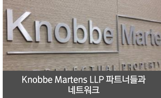
Knobbe Martens LLP 파트너들과 네트워크