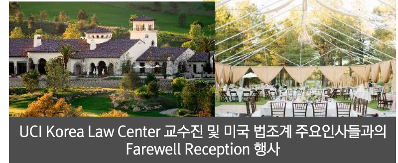
UCI Korea Law Center 교수진 및 미국 법조계 주요인사들과의 Farewell Reception 행사

방문예정기관 (각 1개의 로펌 및 기업 방문예정 / 방문기관은 일부 변동될 수 있습니다.)