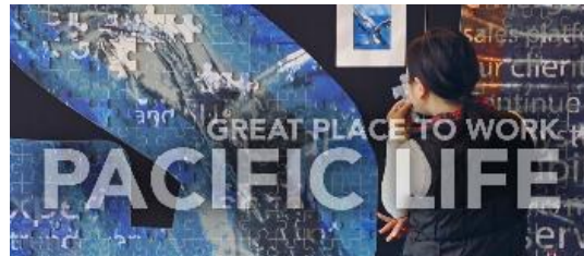
싱가폴에 위치한 글로벌기업 법무담당자들과의 간담회