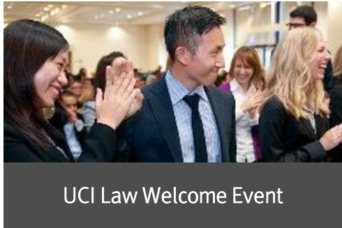
UCI Law Welcome Event