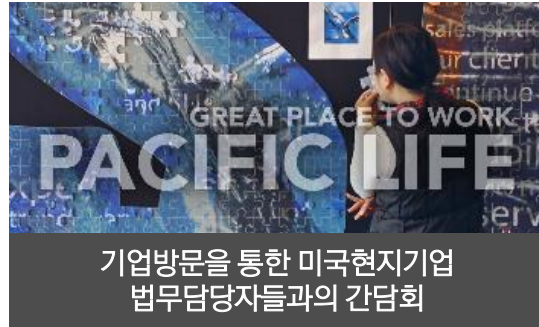
기업방문을 통한 미국현지기업 법무담당자들과의 간담회