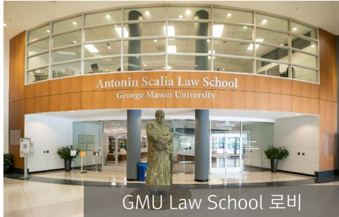
GMU Law School 로비